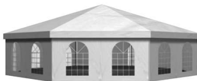
Larghezza 1.500 cm