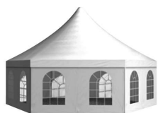
Larghezza 600/800 cm H lato 229 cm