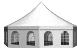
Larghezza 1.000 cm H lato 229 cm